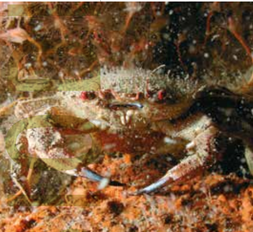
fluwelen zwemkrab