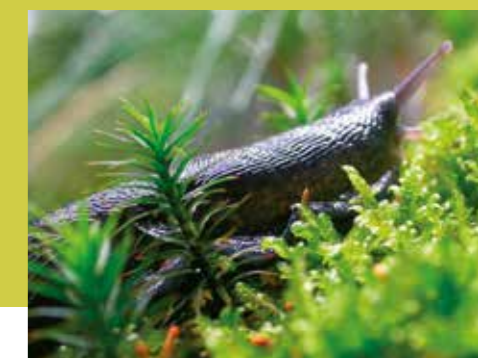
zwarte aardslak

Voor zijn relatief geringe oppervlakte vertoont Wallonië een opvallende ecologische en klimatologische verscheidenheid. De lemige bodems ten noorden van Samber en Maas worden vooral gebruikt voor akkerbouw. Het zuidelijke deel van Wallonië vertoont een meer uitgesproken reliëf en bebossing.