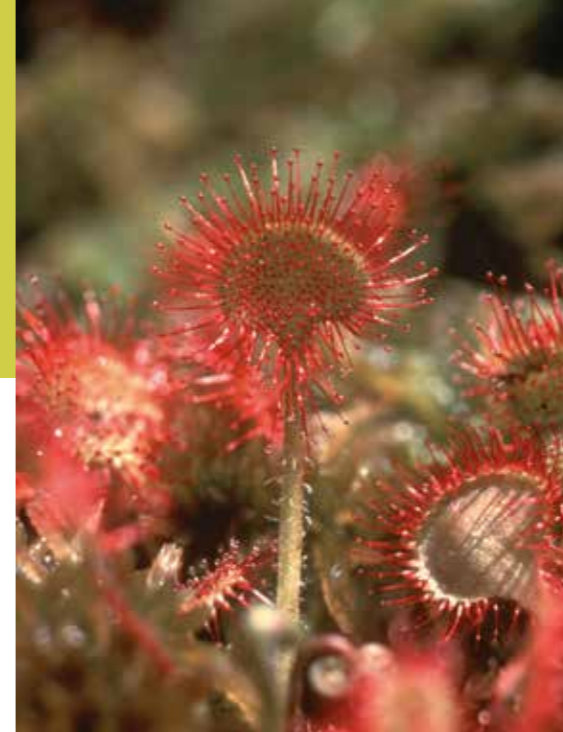
ronde zonnedaauw