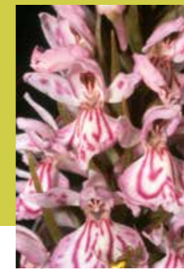
gevekte orchis

deze groepen vaak een essentiële rol in vele voedselketens en in natuurlijke processen zoals humusvorming.