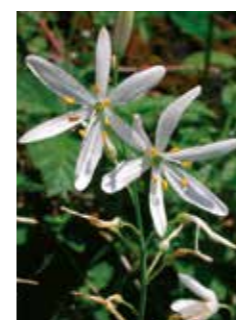
grote graslelie

Fagne-Famenne, met kalkhoudende hellingen, vertoont daarentegen een warmteminnende vegetatie, gedomineerd door eikenbossen, droge graslanden en weilanden met grote erfgoedwaarde.