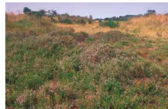
duinen met vegetatie