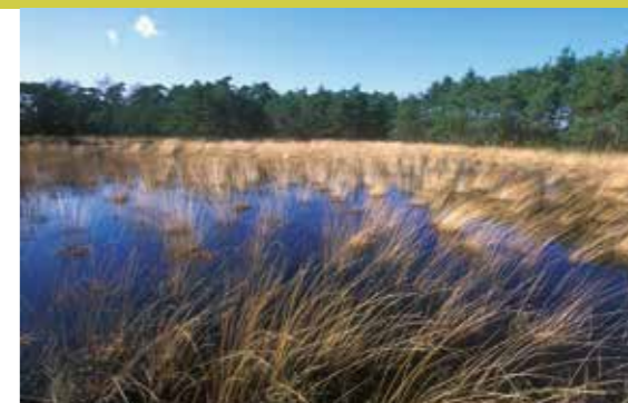
ven in Kalmthoutse heide

Onder Natura 2000 wordt momenteel bijna 16% van het Belgische grondgebied beschermd (zie kaart). Niet minder dan 59 habitattypes komen hierin voor. In vergelijking met de natuurreservaten zorgt de meer flexibele aanpak van Natura 2000, op relatief korte termijn, dus voor een vertienvoudiging van de totale beschermde oppervlakte in België. De natuurreservaten zijn grotendeels opgenomen in de aangeduide Natura 2000-gebieden, maar ze behouden wel hun strengere beschermingsstatus.