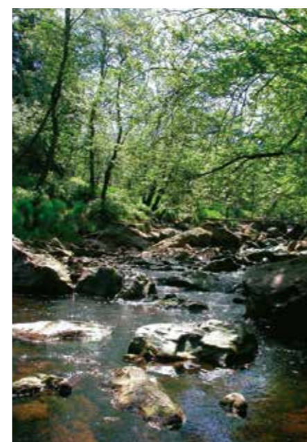
vallei van de Helle

Voor zijn relatief geringe oppervlakte vertoont Wallonië een opvallende ecologische en klimatologische verscheidenheid. De lemige bodems ten noorden van Samber en Maas worden vooral gebruikt voor akkerbouw. Het zuidelijke deel van Wallonië vertoont een meer uitgesproken reliëf en bebossing.