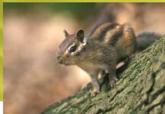
Aziatische grondeekhoorn

Het Brussels Hoofdstedelijk Gewest is een verhaal apart door zijn kleine oppervlakte, doorgedreven verstedelijking, hoge bevolkingsdichtheid, intense economische activiteit en dichte infrastructuur. Maar ook grote steden en hun rand vertonen vaak een hoge en onverwachte biodiversiteit.