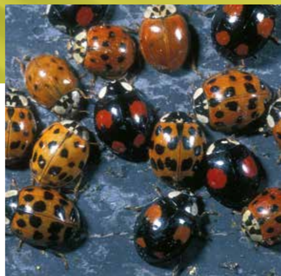
veelkleurig Aziatisch lieveheersbeestje

Grondig onderzoek wees uit dat ongeveer 22.800 diersoorten zijn geregistreerd in België. Maar dit is niet alles want er is een grote kans dat soorten die bv. in het zuiden van Nederland, het noorden van Frankrijk, het westen van Duitsland en/of in het Groothertogdom Luxemburg werden gevonden, ook in België voorkomen, zelfs al heeft niemand ze tot nu toe in ons land waargenomen.